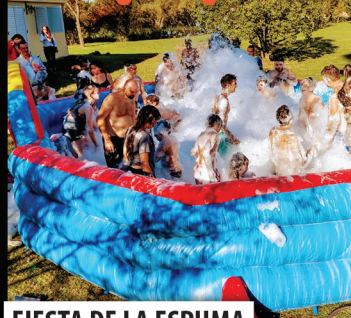
FIESTA DE LA ESPUMA