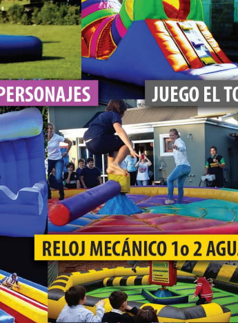
ANIMACIONES TEMÁTICAS CON PERSONAJES