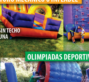
TORO MECÁNICO o INFLABLE