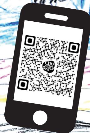
Ilustración por MARIA DELFINA ARCE

la guía de los chicos en los countries y barrios privados también en escuelas y locales comerciales