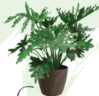
*Philodendron ejemplo Filodendron - Philodendron

Aunque a veces mantener una planta en el hogar parezca una misión imposible, lo importante es saber por dónde empezar. La encargada de Los Lapachos recomienda arrancar con plantas resistentes, que sean fáciles de mantener así "evitamos frustraciones, como las Sansevierias o los helechos como el Asplenium o Philodendros". Pero una vez que nos aventuramos en llenar